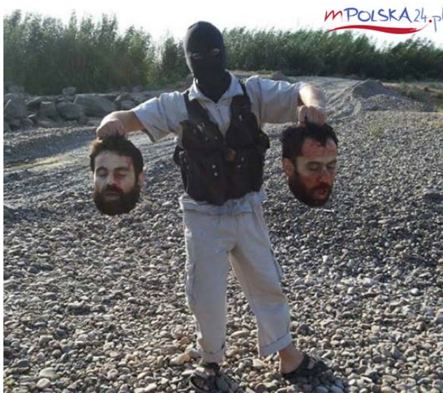
Křesťané v Raqqa