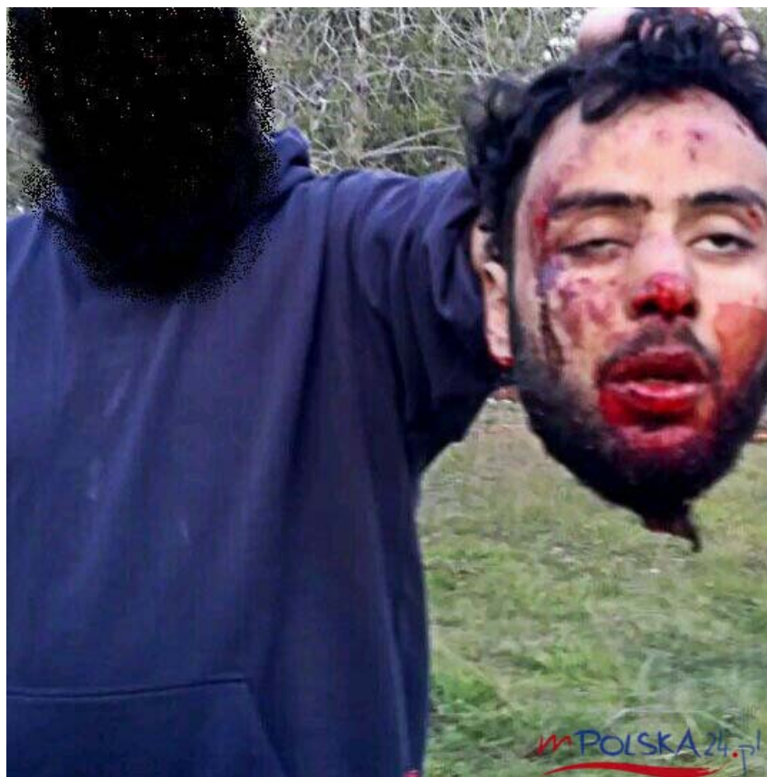
1700 poprava vězňů v Tikritu