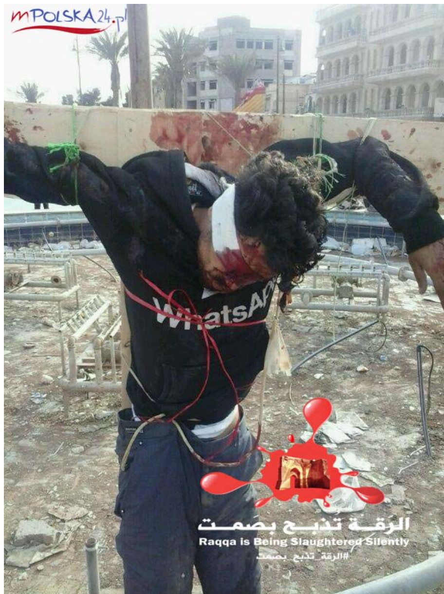
Al Shaer Sýrie 21.července